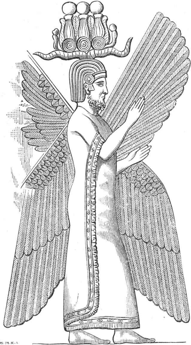
Una representación del primer rey persa, Ciro. Por Ernst Wallis et al, dominio público.

Los caballos, caminos y gobiernos regionales del Imperio Persa unificaron territorios distantes de manera política y económica. Las innovaciones administrativas de los persas también vincularon a las sociedades del Mediterráneo, el Océano Índico y Asia central en una red comercial de larga distancia. El emperador persa Darío también facilitó el comercio estandarizando la moneda de oro que portaba su nombre, el dárico . Esto significaba que los comerciantes ahora tenían una medida común de valor dondequiera que fueran en el imperio.