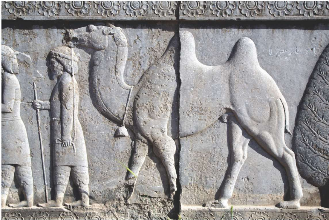
Relieve con camello, Persépolis, Irán.

Los comerciantes debieron encontrar maneras de trasladar su mercancía de forma eficiente. Aquí es donde participan los camellos, ya que eran la mejor manera de viajar. Los pueblos nómadas de Asia Central comenzaron a domesticar camellos a comienzos del segundo milenio a.C. Por ejemplo, los chinos Han usaron camellos capturados de los Xiongnu para transportar suministros militares. Los camellos eran fuertes. ¡Soportaban las duras condiciones del desierto de Asia Central y podían cargar hasta 500 libras! Sin animales de carga, especialmente camellos, el transporte de mercancías por tierra en la Ruta de la Seda no habría valido la pena.