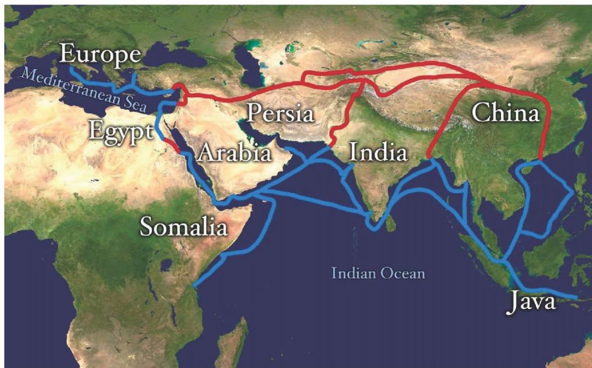
Extensión de las Rutas de la Seda. Rojo corresponde a la ruta terrestre y azul corresponde a la ruta marítima/agua. Dominio público.

Aunque Roma y la China Han se expandieron demasiado, todavía existía mucha distancia entre ellos. Asia Central está cubierta de montañas, desiertos y vastas praderas, así que no es como si la gente viajara a través de ella por diversión. Los comerciantes, que tuvieron una buena razón financiera para realizar estas difíciles travesías, sirvió de vínculo fundamental en la creación de redes entre los imperios romanos y Han.