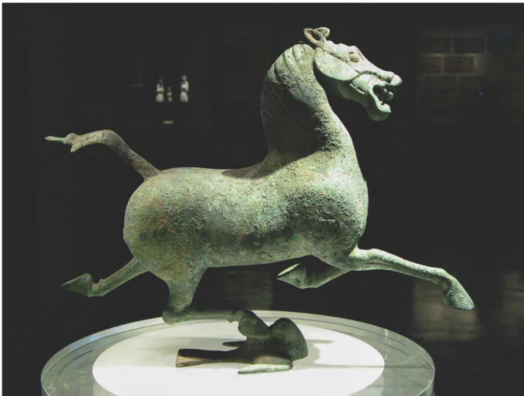
"Caballo celestial" de Ferghana, ilustrado en una escultura de bronce del siglo II d.C. de la China Han.

Una causa del comercio expandido fue el crecimiento del poder imperial. Cerca del final del siglo II a.C., la dinastía Han, dirigida por el emperador Wu, estaba en conflicto con las comunidades nómadas, llamadas Xiongnu. Los jinetes de Xiongnu han saqueado los asentamientos chinos a lo largo de la frontera septentrional por muchos años. Después de organizar muchas campañas contra los Xiongnu, el emperador Wu decidió que era hora de encontrar una nueva fuente de caballos si alguna vez pretendían triunfar en esta pelea.