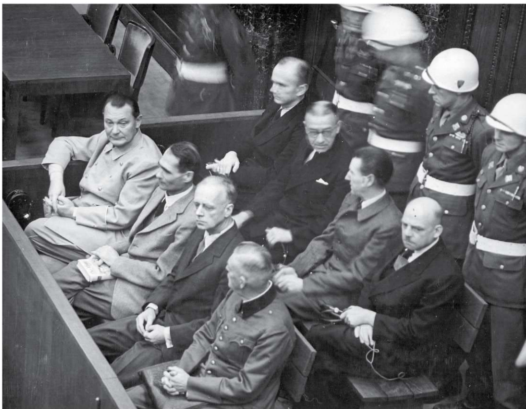
Los juicios de Núremberg . Acusados en el banquillo de los acusados; Goering, Hess, von Ribbentrop y Keitel en primera fila (alrededor de 1945-1946).