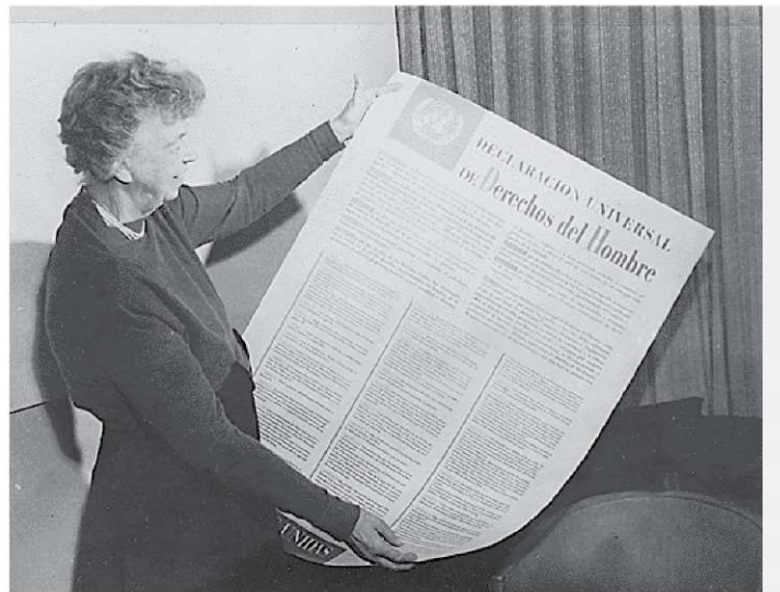
Eleanor Roosevelt y la Declaración Universal de los Derechos Humanos de las Naciones Unidas en idioma español (1949).

Los Principios de Núremberg fueron uno de los resultados de los juicios de Núremberg. Estas siete reglas explican qué es un crimen de guerra. Además de definir cosas como "crímenes de lesa humanidad", los principios también dejan claro que "solo cumplía órdenes" no es una defensa para cometer crímenes de guerra. Los Principios de Núremberg formaban parte de un conjunto más amplio de documentos y concepciones en evolución sobre lo que son el derecho internacional y los derechos humanos. Los historiadores de derechos humanos atribuyen a los juicios de Núremberg el haber sentado las bases de la Declaración Universal de Derechos Humanos (1948), la Convención para la Prevención y la Sanción del Crimen de Genocidio (1948) y los Convenios de Ginebra de 1949, que constituyen la base del derecho internacional humanitario y de las leyes de la guerra.