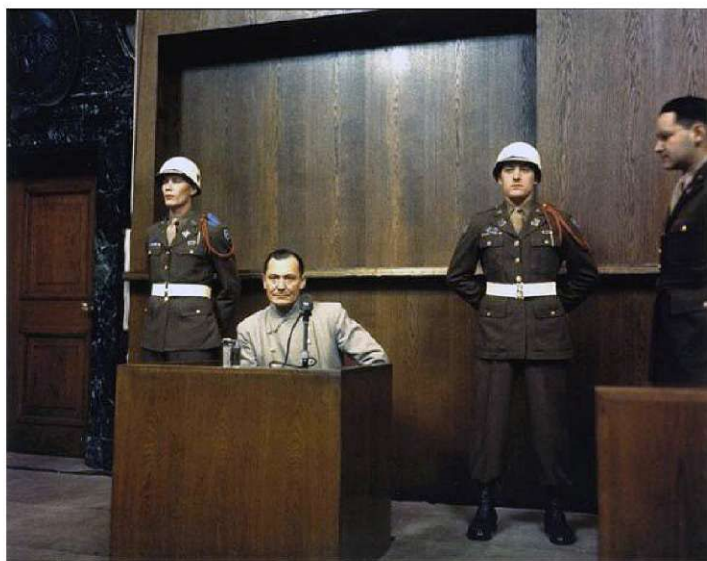
Hermann Goering en su juicio en Núremberg (1946) . Por Raymond D'Addario, dominio público.

Los Juicios de Núremberg fueron un total de trece juicios a oficiales nazis celebrados entre 1945 y 1949. Se celebraron en la misma ciudad donde, una década antes, Hitler había declarado las Leyes de Núremberg. El primero de estos juicios es el más significativo. Estados Unidos, la Unión Soviética, el Reino Unido y Francia celebraron este primer juicio, denominado Tribunal Militar Internacional. Los doce juicios siguientes fueron organizados únicamente por Estados Unidos, lo que presagió las posteriores tensiones de la Guerra Fría entre Estados Unidos y la Unión Soviética. Los juicios pretendían hacer responsables a los dirigentes alemanes de crímenes tan graves que requerían una jurisdicción (autoridad) más allá de las fronteras de cualquier estado: crímenes contra la paz, crímenes de guerra y crímenes de lesa humanidad. La naturaleza de estos tres tipos de crímenes, según los aliados, requería una solución internacional.