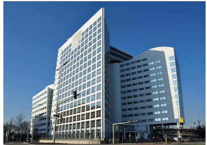
El Tribunal Penal Internacional (TPI), La Haya, Países Bajos (2011).

Eleanor Roosevelt, que dirigió el comité que redactó la DUDH, quería un tratado vinculante que incorporara firmemente los derechos humanos al derecho internacional. Sin embargo, el presidente Harry Truman dio instrucciones a Roosevelt para que rechazara cualquier tratado vinculante y redactara en su lugar una resolución no vinculante (declaración o juramento). La Declaración Universal es el documento más traducido de la historia. Sin embargo, tras su redacción, los representantes del Imperio Británico llevaron a cabo una campaña secreta en las Naciones Unidas para limitar la traducción del documento a las lenguas de las colonias británicas. Estados Unidos y Gran Bretaña acababan de librar una guerra y celebrar juicios contra los crímenes nazis y el imperialismo. Sin embargo, ambos países temían ceder su propio poder a las Naciones Unidas. Desde que se inauguró el TPI en 2002, los únicos dirigentes llevados a juicio han sido de África. Tanto Estados Unidos como Rusia firmaron inicialmente el tratado por el que se creaba la TPI y posteriormente retiraron sus firmas.