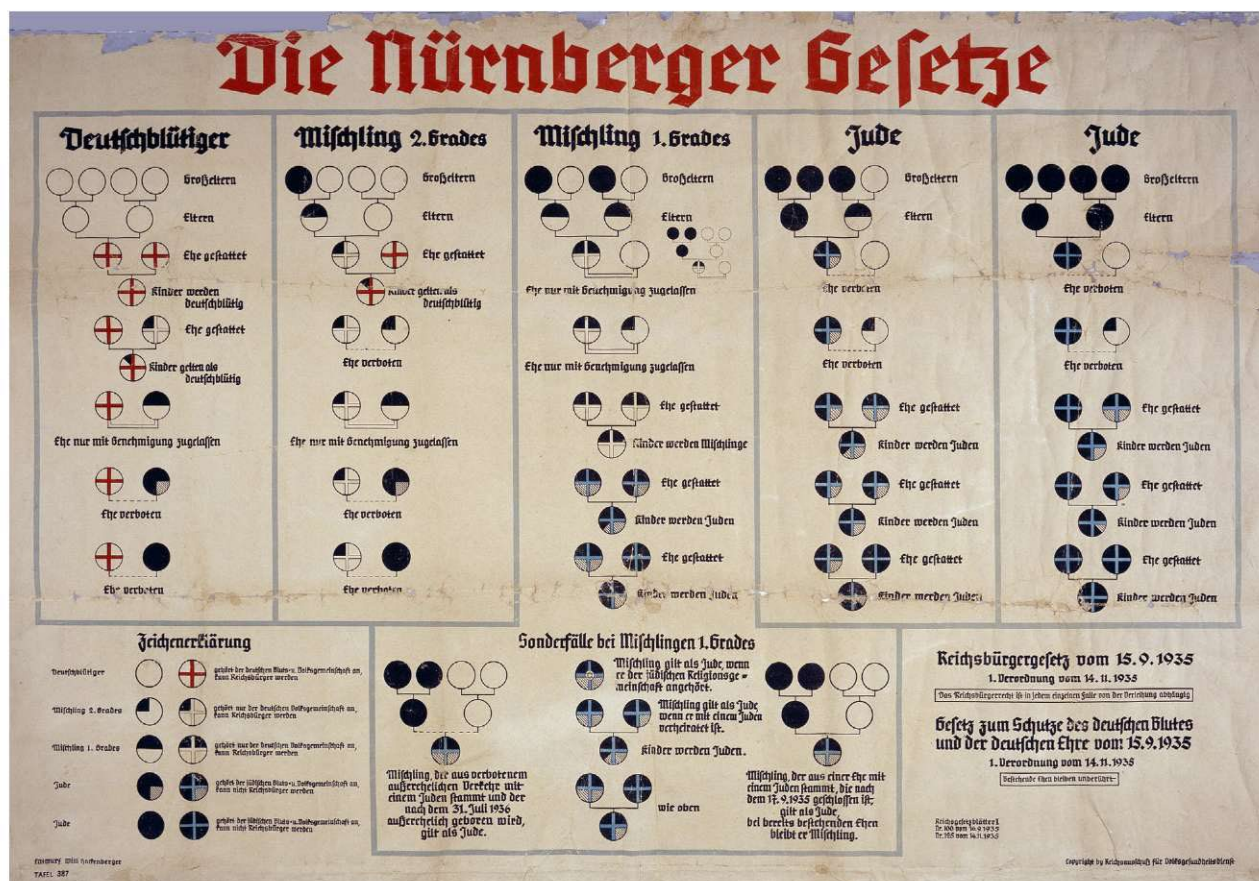
Un gráfico que explica las categorías raciales pseudocientíficas establecidas por las Leyes de Núremberg de 1935. Los círculos blancos identifican a los antepasados de sangre alemana "pura", mientras que los círculos negros identifican la ascendencia judía. Solo aquellos que tenían cuatro abuelos no judíos eran considerados plenamente alemanes (1935).

El 15 de septiembre de 1935, en un mitin del Partido Nazi en Núremberg, Alemania, los dirigentes nazis promulgaron un conjunto de leyes conocidas como las Leyes de Núremberg. Al señalar a la población judía de Alemania, estas leyes pretendían crear una sociedad homogénea. Las leyes procedían de la ideología nazi, una forma extrema de eugenesia y darwinismo social. 1 Estas ideas fueron populares entre los imperialistas del siglo XIX y principios del XX. Las Leyes de Núremberg definían a los judíos alemanes no por sus creencias religiosas, sino por su ascendencia. Les quitaron la ciudadanía e impusieron restricciones a su empleo y a su capacidad para casarse.